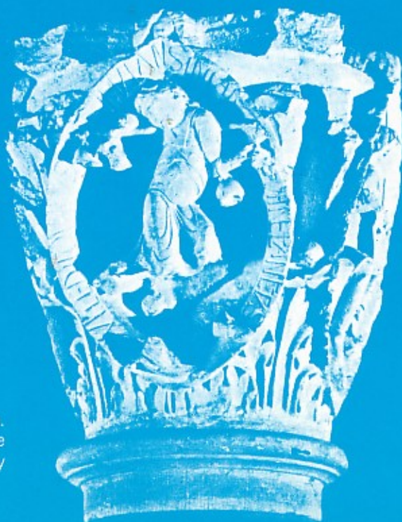
I toni della musica gregoriana. Capitelli della chiesa abbaziale Cluny